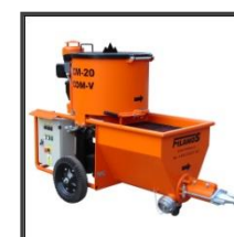
Injektážní čerpadlo řady CM