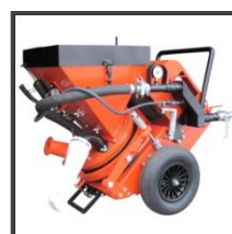
Torkretovací stroj SSB 14.1 / SSB 24.1