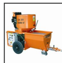
Injektážní čerpadlo řady CA