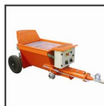
Injektážní čerpadlo řady C