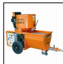
Injektážní čerpadlo řady CA