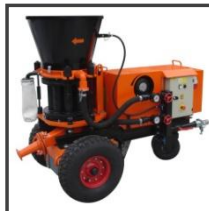
Torkretovací stroj SSB 02.1