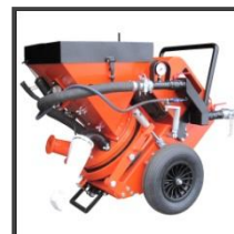
Torkretovací stroj SSB 14.1 / SSB 24.1