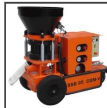
Torkretovací stroj SSB 05.1