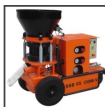
Torkretovací stroj SSB 05.1